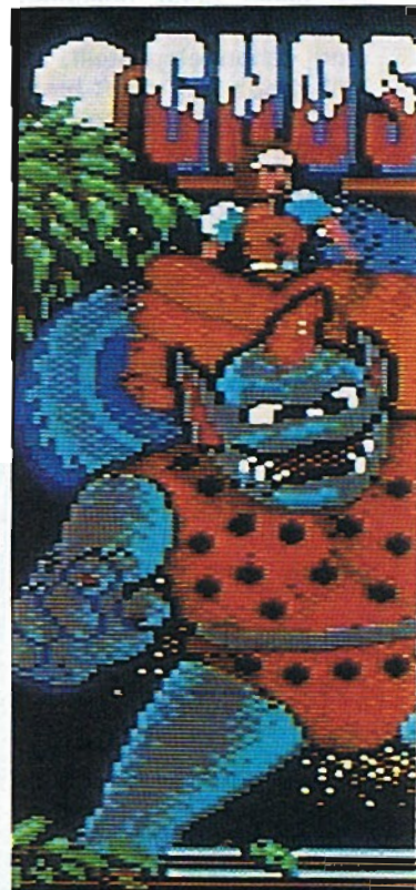
Das Titelbild von »Ghosts'n Goblins«

Zunächst wende ich mich nach rechts, kämpfe mit Zombies, sammle Säcke ein und überspringe Grabsteine, bis ich an einen Hügel komme. Hier greift mich ein großer Vogel an, der jedoch mit dem Schwert recht leicht zu überwinden ist. Ich klettere eine Leiter empor und werde gleich mit dem nächsten Naturwunder konfrontiert: Eine höchst aggressive Blume bespuckt mich mit tödlichen Feuerkugeln. Ich beseitige sie mit meinem Schwert und setze meinen Weg nach rechts fort. Eine zweite Pflanze dieser Gattung »erlegt« mich nur einige Sekunden später. Und hier zeigt sich schon das ersten Ärger-